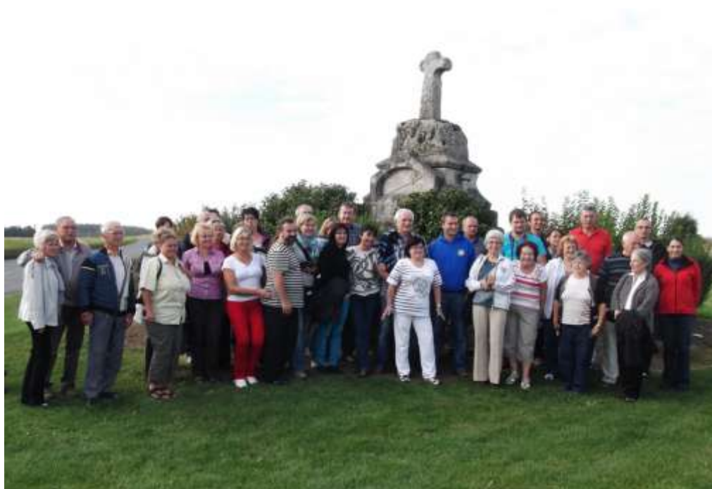
Dvur Kralove Nad labem sur leur territoire en France!