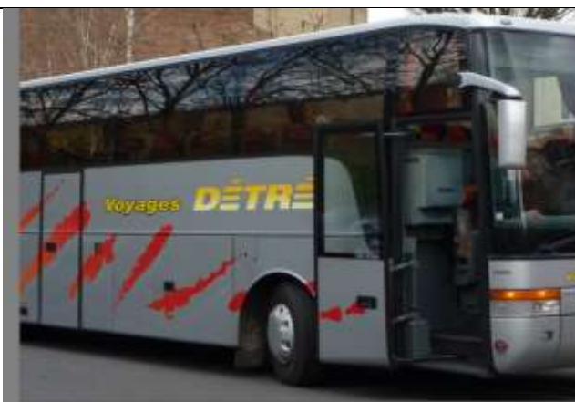
Un des derniers cars pris par nos vernoliens pour aller à Shelford