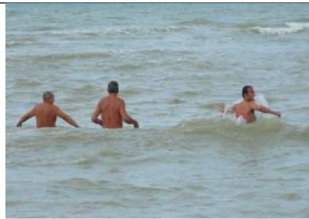
Nos amis tchèques dans l'eau du Touquet

En 2013 c'était le tour de Verneuil en Halatte d'organiser la désormais classique triangulaire. 35 Italiens et 45 tchèques ont passé trois jours à Verneuil. Au programme Paris le Louvre, le Touquet, la croix du Roi de Bohême (un territoire tchèque à Crécy en Ponthieu), une réunion des trois délégations et de la municipalité pour préparer les prochaines rencontres, le dimanche une messe émouvante avec les participations de nos amis tchèques et italiens. Tous ont été logés dans des familles qui ont pour certains retrouvé des amis de longues dates, pour d'autres tisser des liens d'amitiés.