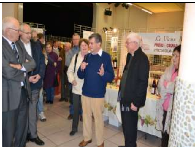
Great and Little Shelford au salon gastronomique