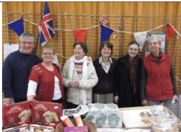
Nos amis Anglais fidèles au salon de la gastronomie