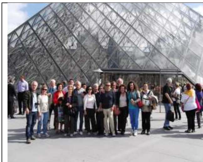
Piegaro au Louvre