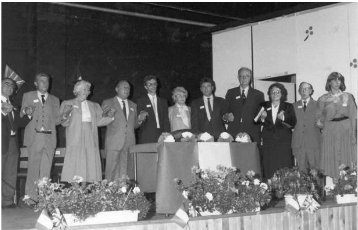
Il y a déjà 25 Ans