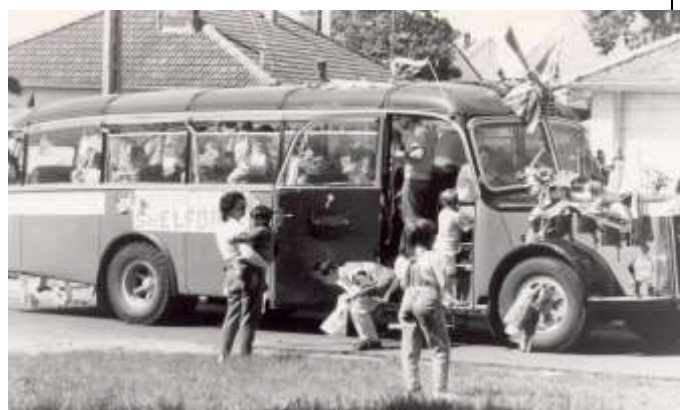
Un des premiers cars pris par nos amis anglais pour venir à Verneuil en Halatte