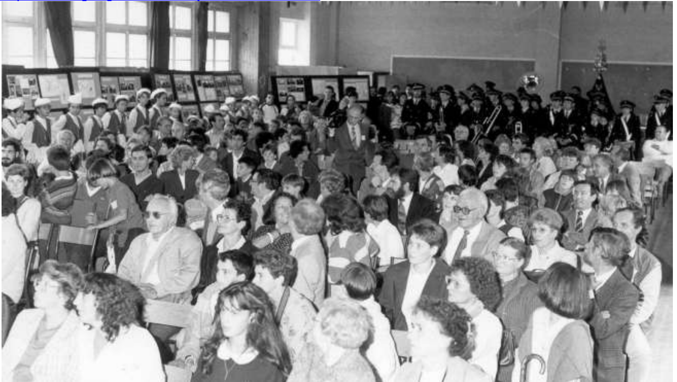
Une des toutes premières réceptions !

https://sites.google.com/site/cjverneuilenhalatte/